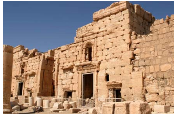
Templo de Beel

Por la tarde, ya finalizada la visita, sugerimos dar un paseo relajado por el palmeral o si aún tiene fuerzas subir a la fortaleza árabe del siglo XVII, Qalaat Ibn Maan , que sobre la cima de un antiguo cono volcánico proporciona una vista extraordinaria de las ruinas de esta mítica ciudad y de su oasis.