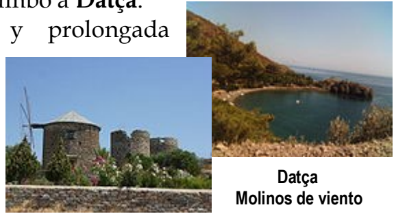
Datça Molinos de viento

Datça ubicada en la estrecha y prolongada península del mismo nombre, rodeada de pinos, fue en otro tiempo un pequeño pueblo, paraíso de mochileros; hoy la afluencia de embarcaciones de recreo la ha hecho crecer, pero aún resulta más tranquila que Mármaris o Bodrum.