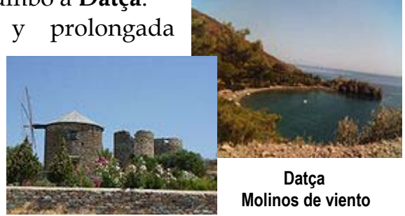
Datça Molinos de viento

Datça ubicada en la estrecha y prolongada península del mismo nombre, rodeada de pinos, fue en otro tiempo un pequeño pueblo, paraíso de mochileros; hoy la afluencia de embarcaciones de recreo la ha hecho crecer, pero aún resulta más tranquila que Mármaris o Bodrum.