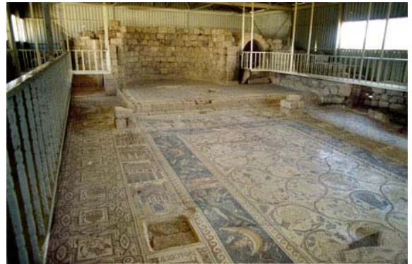
Iglesia de San Esteban

Concluida la visita saldremos hacia Petra, la ciudad rosa del desierto. Alojamiento y cena en el hotel.