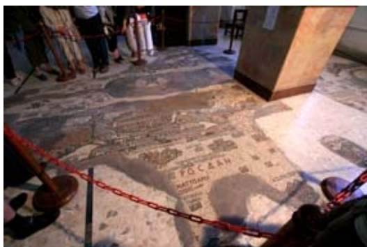
Iglesia de San Jorge (mosaico del mapa)

Desayuno. Comenzaremos el día realizando una visita panorámica a la ciudad de Ammán . Después saldremos hacia la ciudad de Mádaba , el centro cristiano más importante de Jordania, llamada “la ciudad de los mosaicos” por reunir en sus iglesias y museos la mayor colección de mosaicos del país. Allí visitaremos la Iglesia Ortodoxa de San Jorge (“Iglesia del Mapa”) que alberga en su suelo el famoso mosaico del “mapa de Palestina”.