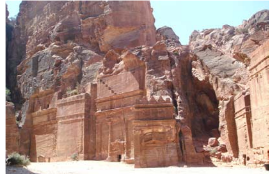
Calle de las Fachadas

Visitaremos las Tumbas Reales , excavadas en la ladera del Jebel al-Khubtah, contemplaremos la Calle de las Fachadas .