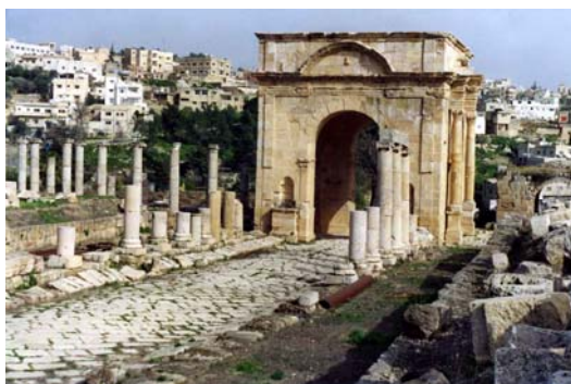
Tetrapilon Norte (Jerash)

cerámica la que ayudó a Gerasa a mantener su nivel de vida e incluso a crear riqueza durante los períodos tardorromano, bizantino y omeya. En el 359 adoptó el Cristianismo, iniciando la edificación de numerosas iglesias, junto a templos y sinagogas, y bajo el Imperio Bizantino, con el gran Justiniano (siglo VI) volvió a renacer. En el 636 cayó bajo el poder de los árabes y en el año 749 un tremendo terremoto sembró la destrucción. El declive de Gadara fue gradual y generalizado, causado no por una ruptura cultural violenta entre los mundos bizantino e islámico, sino a la creación de nuevas rutas comerciales cuando la capital del Islam se trasladó de Damasco a Bagdad, y la ciudad lentamente desapareció.