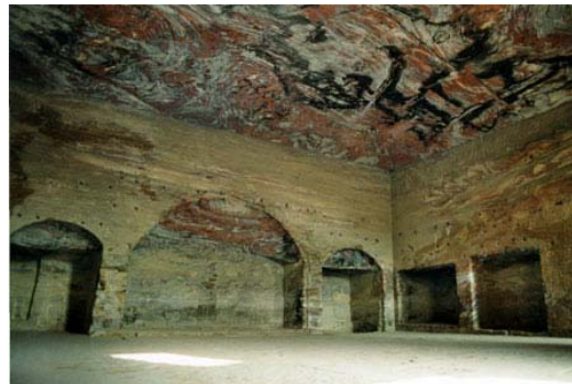
TUMBA DE LA URNA Interior y fachada

Terminaremos subiendo al Monasterio (Al-Deir) para admirarnos con su enorme fachada de casi 50 m2 y contemplar desde la cumbre de la montaña las magníficas vistas de toda Petra y de Wadi Araba. Desde allí iniciaremos el regreso al hotel, y nuevamente a través del “siq” volveremos a fascinarnos con el entorno que nos rodea, pero esta vez a la luz del atardecer.