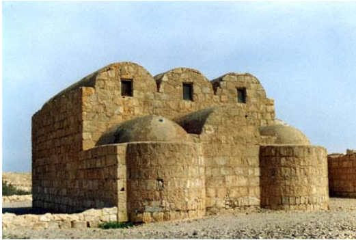
de los Seis Reyes” y un largo etcétera.