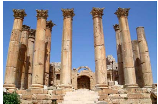
Templo de Artemisa (Jerash)

Gerasa a mantener su nivel de vida e incluso durante los períodos tardorromano, bizantino y omeya. En el 359 adoptó el Cristianismo, iniciando la edificación de numerosas iglesias, junto a templos y sinagogas, y bajo el Imperio Bizantino, con el gran Justiniano (siglo VI) volvió a renacer. En el 636 cayó bajo el poder de los árabes y en el año 749 un tremendo terremoto sembró la destrucción. El declive de Gadara fue gradual y generalizado, causado no por una ruptura cultural violenta entre los mundos bizantino e islámico, sino a la creación de nuevas rutas comerciales cuando la capital del Islam se trasladó de Damasco a Bagdad, y la ciudad lentamente desapareció.