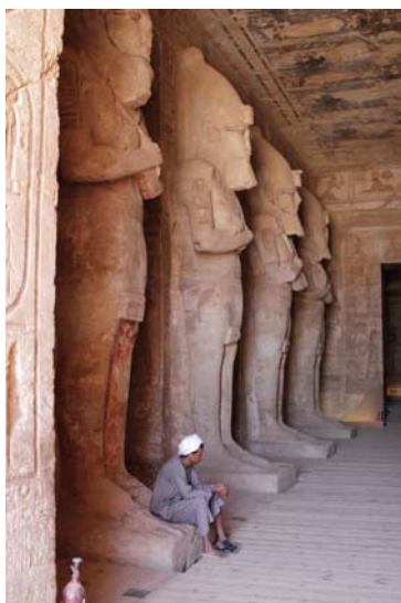
Templo de Ramsés II

Al atardecer asistiremos al “ ESPECTÁCULO DE LUZ Y SONIDO ” ante los impresionantes templos de Abu Simbel.