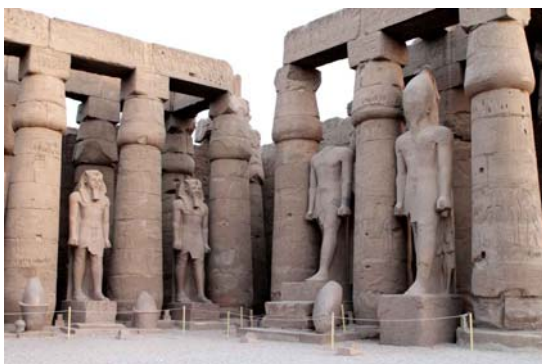
Patío de Ramsés II. Templo de Luxor