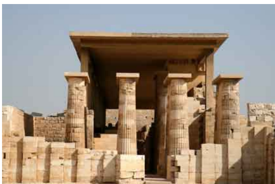
Columnata de entrada. Complejo de Djoser

morada. La función funeraria de la zona continuó durante las épocas saíta y persa (en torno a los siglos VII y VI a. C.) y ptolemaica, cuando fue finalmente abandonada como necrópolis, hasta que en el siglo V d. C. fue ocupada por los coptos, que construyeron un gran e importante monasterio dedicado a San Jeremías. Sus monumentos corrieron diferente suerte; unos fueron sepultados por la arena del desierto, olvidados y afortunadamente preservados, mientras que otros han servido de cantera durante siglos, hasta que en 1927 Jean Philippe Lauer iniciara la excavación y reconstrucción de este espléndido yacimiento.