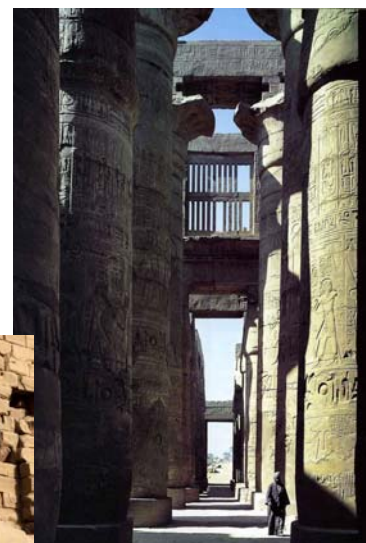
Templo de Amón. Sala hipóstila.