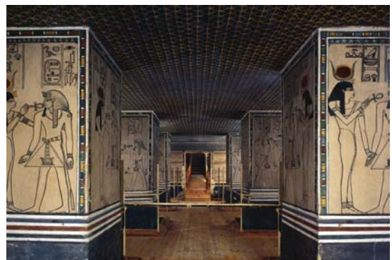
Tumba de Amenhotep II. Valle de los Reyes. Din. XVIII. Hacia 1410 a. C.

Proseguiremos hacia el Valle de los Artesanos conocido como Deir el Medina , un pequeño poblado al borde de los cultivos, donde vivieron los artesanos constructores de las tumbas reales durante más de 500 años.