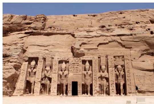
Templo de Nefertari

Regreso a Aswan. Alojamiento en el hotel.