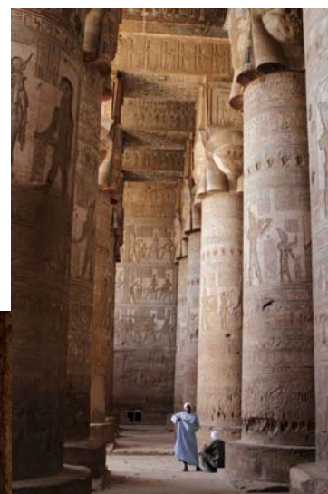
Templo de Hathor. Sala Hipetra