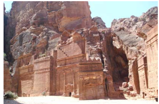
Calle de las Fachadas

Desde Al-Deir iniciaremos el regreso al hotel, y nuevamente a través del “siq” volveremos a fascinarnos con el entorno que nos rodea, pero esta vez a la luz del atardecer.