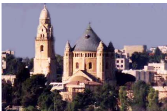
Abadía de la Dormición de María