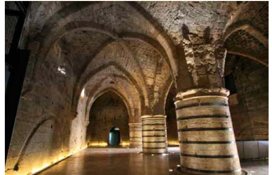
Sala de los Caballeros. Ciudad de los Cruzados San Juan de Acre (Akko)

Concluida la visita continuaremos hacia Galilea , la tierra de Jesús donde vivió y predicó su revolucionaria doctrina.