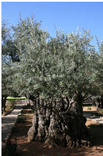
Huerto de Getsemani.

Desayuno y salida hacia el Monte de los Olivos y desde el mirador gozaremos de una magnífica vista panorámica de la ciudad antigua, con sus murallas y puertas, el Monte del Templo o Monte Moria y todos y cada uno de los principales edificios conmemorativos de la vida de Cristo