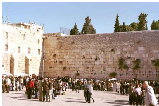
Muro de las Lamentaciones. Jerusalén

Desayuno. Nos dirigiremos al corazón del mundo judío, el Muro de las Lamentaciones , lugar donde los judíos veneran la memoria del Templo construido por Salomón y definitivamente destruido por los romanos en el año 70 de nuestra Era.