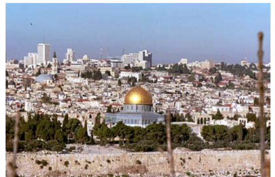
Vista de la Cúpula de la Roca en el Monte del Templo desde el Monte de los Olivos.

Descenderemos al Valle de Cedrón (o Valle de Josafat). Al pie de la colina, entre olivos centenarios testigos de la agonía y prendimiento de Cristo, se halla el Huerto de Getsemaní y la Iglesia de las Naciones (o de la Agonía),