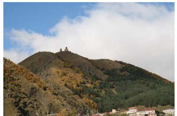
Vista de la iglesia de la Trinidad de Gergeti desde el pueblecito de Kazbegi.

Su ubicación es impresionante y el misticismo que se respira en su interior no nos dejará indiferentes.