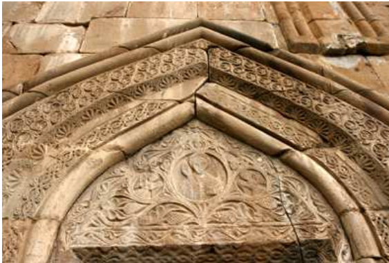
Tímpano puerta meridional

La fortificación encierra varias edificaciones: una alta torre y dos iglesias: la Iglesia de la Virgen en cuyo interior se hallan varias tumbas de los Señores del lugar, y la Iglesia de la Asunción con muros exteriores ricamente decorados y con pinturas murales en su interior.