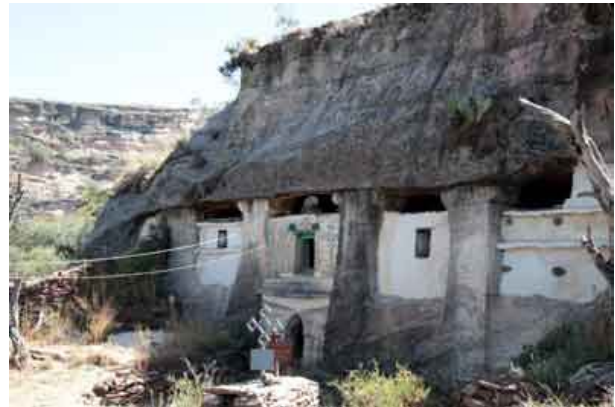
Iglesia rupestre de Mehane Alem Adi Kasho. Fachada exterior y puerta de la iglesia.

Las iglesias más conocidas son Wukro Cherkos, Petros y Paolos, Abraha Atsba, Medhanialem Adi Kasho, Maryam Korkor y Abune Yemata, algunas de difícil acceso.