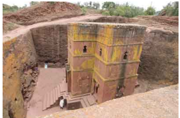
Iglesia de BET GIYORGIS (San Jorge)

El conjunto arquitectónico excavado en escoria de basalto está formado por once iglesias, de las cuales cuatro están completamente separadas de la roca por fosos, mientras que las demás forman complejos hipogeos conectados por trincheras y galerías. Los templos se concentran en tres grupos. El primero situado al NO, de evidente origen religioso y simboliza la “Jerusalén terrenal”; el segundo, situado al SE, simboliza la “Jerusalén celestial”, que por sus extrañas formas y fosos, los arqueólogos sugieren que originalmente pudo ser el área palatina de los Zagüe; y por último la