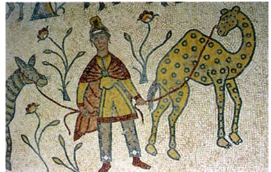
Iglesia Conmemorativa de Moisés. Monte Nebo Detalle mosaico.

Proseguiremos hacia el Sur a lo largo del Camino Real, una de las rutas comerciales más antiguas del mundo que atraviesa Jordania de Norte a Sur, lo que nos permitirá contemplar impresionantes paisajes.