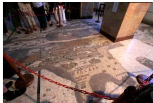
Iglesia de San Jorge (Madaba)