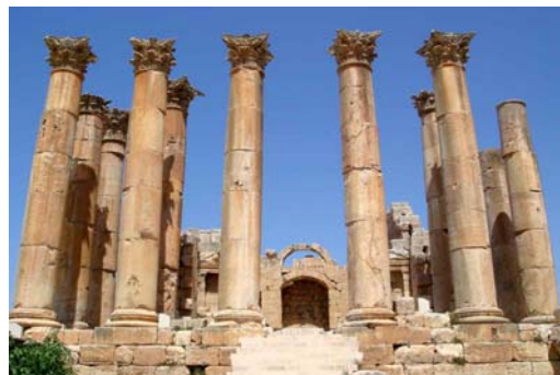
Templo de Artemisa (Jerash)