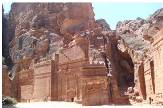
Calle de las Fachadas