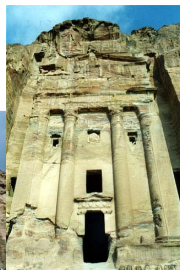
TUMBA DE LA URNA