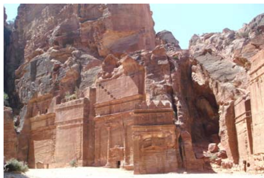
Calle de las Fachadas

Desde Al-Deir iniciaremos el regreso y nuevamente a través del “siq” volveremos a fascinarnos con el entorno que nos rodea, pero esta vez a la luz del atardecer.