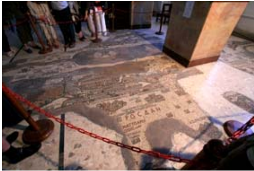
Iglesia de San Jorge (mosaico del mapa)

Viajes Próximo Oriente S. L. – CICMA 1.759 C/ Alcalá, nº 302 - Planta 1ª Oficina 3. Madrid 28027 - ESPAÑA Tel.: 91 3773194 / Fax: 91 3773772 info@viajesproximoriente.com www.viajesproximoriente.com