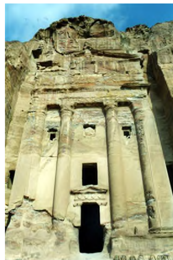
Tumba de la Urna

Por la tarde nos dirigiremos a la cercana población de Al Beida , conocida como la “ pequeña Petra ”, en otro tiempo caranvanserai (albergue caravanero) de la capital nabatea.