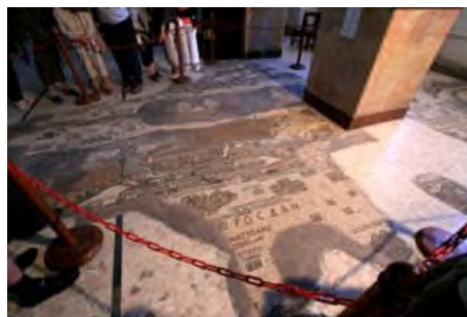
Iglesia de San Jorge (Madaba)

Continuaremos hacia Monte Nebo (al-Siyaghá), donde además de admirar una extraordinaria vista panorámica del valle del río Jordán y del mar Muerto, visitaremos la Iglesia Conmemorativa de Moisés , del siglo VI, que conserva interesantes mosaicos.