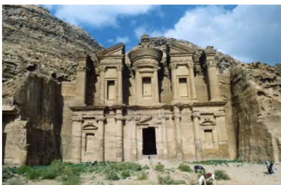
Monasterio (Al Deir)

Visitaremos las Tumbas Reales , excavadas en la ladera del Jebel al-Khubtah. Terminaremos subiendo al Monasterio (Al-Deir) para admirarnos con su enorme fachada de casi 50 m2 y contemplar desde la cumbre de la montaña las magníficas vistas de toda Petra y de Wadi Araba. Desde allí iniciaremos el regreso al hotel, y nuevamente a través del “siq” volveremos a fascinarnos con el entorno que nos rodea.