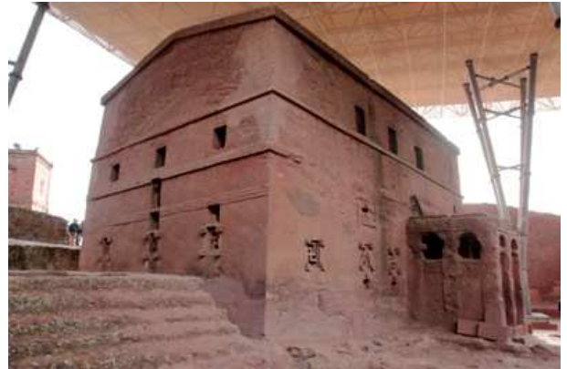
Iglesia de BET MARYAM

A través de un pasadizo se accede a la mayor de todas, la espectacular Medhane Alem (Salvador del Mundo) que está rodeada por 30 pilares, cuyo interior está dividido en de 5 naves separadas por 16 pilares unidos entre sí por arcos de medio punto. Las ventanas de estilo axumita aportan escasa luz al interior creando un ambiente de recogimiento.