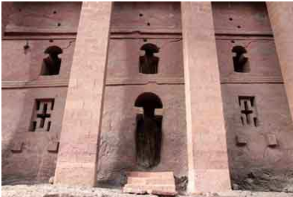
Iglesia de MEDHANE ALEM

Bet Maryam que presenta planta rectangular y tiene tres bellos pórticos de acceso, ocupa el centro del patio, alrededor del cual se organizan los restantes templos. A los lados se hallan las iglesias de Bete Denge (Casa de las Virgenes) y Bete Meskel (Casa de la Cruz).