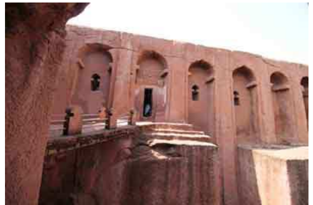
Iglesia de BET GABRIEL-RUFAEL (San Gabriel y San Rafael)