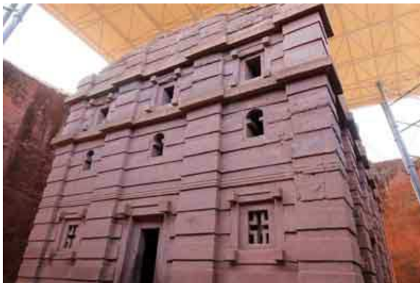
Iglesia de BET EMMANUEL

La iglesia Bet Emmanuel , independiente y monolítica es la más exquisitamente tallada de Lalibela. Algunos han sugerido que fue en su momento capilla palatina para uso exclusivo de la familia real. Sus fachadas imitan las capas de piedra y madera tradicionales en su arquitectura axumita.