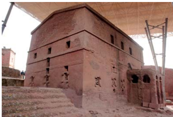
Iglesia de BET MARYAM

A través de un pasadizo se accede a la mayor de todas, la espectacular Medhane Alem (Salvador del Mundo) que está rodeada por 30 pilares, cuyo interior está dividido en de 5 naves separadas por 16 pilares unidos entre sí por arcos de medio punto. Las ventanas de estilo axumita aportan escasa luz al interior creando un ambiente de recogimiento.