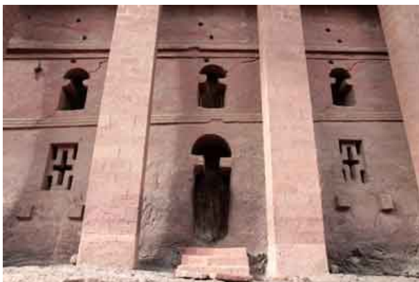
Iglesia de MEDHANE ALEM

Bet Maryam que presenta planta rectangular y tiene tres bellos pórticos de acceso, ocupa el centro del patio, alrededor del cual se organizan los restantes templos. A los lados se hallan las iglesias de Bete Denge (Casa de las Virgenes) y Bete Meskel (Casa de la Cruz).