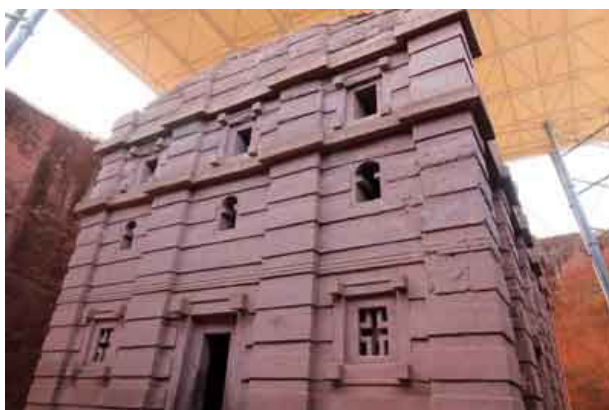
Iglesia de BET EMMANUEL

La iglesia Bet Emmanuel , independiente y monolítica es la más exquisitamente tallada de Lalibela. Algunos han sugerido que fue en su momento capilla palatina para uso exclusivo de la familia real. Sus fachadas imitan las capas de piedra y madera tradicionales en su arquitectura axumita.