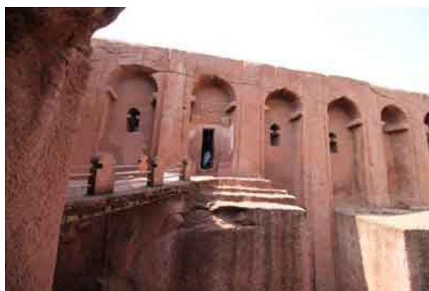
Iglesia de BET GABRIEL-RUFAEL (San Gabriel y San Rafael)