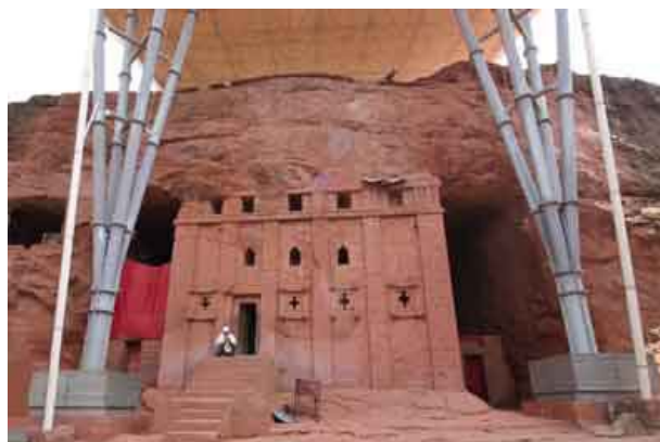
Iglesia de BET ABBA LIBANO

La última iglesia de este conjunto es Bet Abba Libano . Es un buen ejemplo de iglesia-cueva. Excavada en una pared rocosa es única, debido a que solo el techo y el suelo permanecen unidos a la roca. Muchos de sus elementos arquitectónicos, como los frisos son de estilo axumita. Cuenta la leyenda que fue construida en una sola noche por la esposa de Lalibela, Meskel Kebre, con ayuda de una cohorte de ángeles.