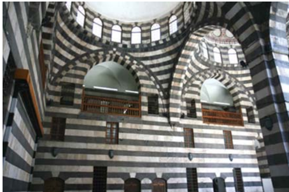
Khan Assad Pasha.

El más sublime de los khans damascenos. Mandado edificar por el gobernador otomano de Damasco a mediados del siglo XVIII, para dar albergue a los mercaderes y sus mercancías.