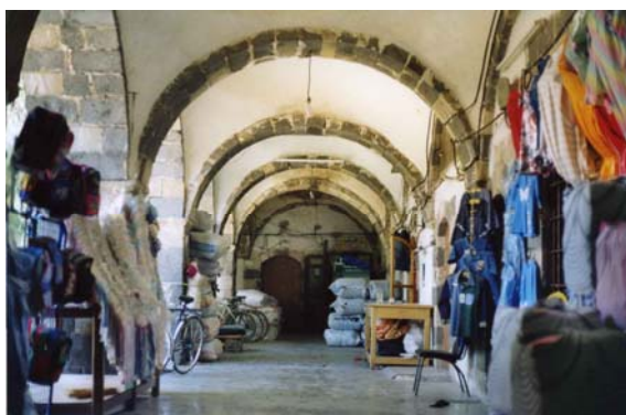
Khan el-Zait. Planta superior

Mezquita de Hisham. De ella destaca su alminar de forma octogonal, construida en 1427 en tiempos mamelucos.