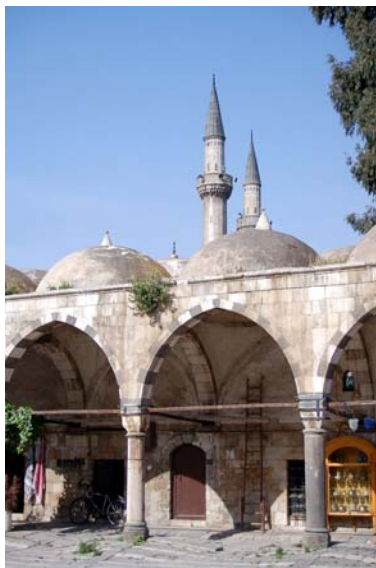
Madrasa de Selim I

:Sinan consiguió su propósito: a través de la cúpula que corona la sala de oración, a través de los esbeltos alminares y del sentido de la proporción transmitió los rasgos típicos de la arquitectura otomana, pero también reflejo los gustos arquitectónicos locales alternando piedra caliza y basáltica en el pórtico de la magnífica Mezquita de Soliman.