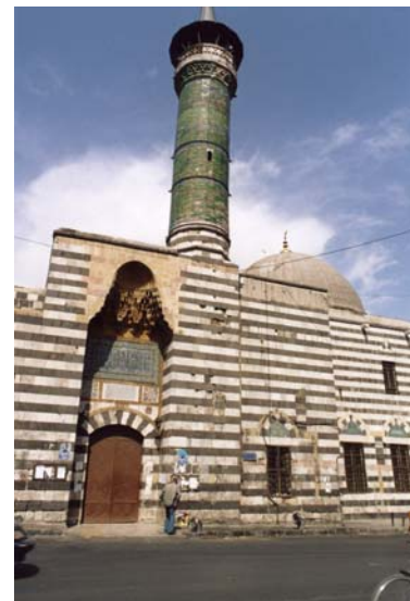
Mezquita de Sinan Pasha

Esta larguísima calle nos llevará al barrio cristino , donde visitaremos la Capilla de San Ananias y la ventana de San Pablo . Completaremos el recorrido con una joya de la arquitectura doméstica otomana, Beit Nizam , para terminar almorzando relajadamente en uno de los numerosos restaurantes de la zona.