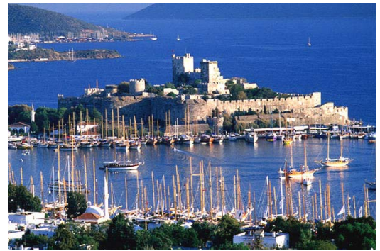
Bahía de Bodrum con el Castillo de San Pedro

Famosa en la antigüedad por albergar la majestuosa Tumba del rey Mausolo, conocida como “Mausoleo de Halicarnaso” (s. IV a. C.), una de las Siete Maravillas del Mundo; hoy, su seña de identidad es el Castillo de San Pedro construido por los Caballeros Hospitalarios en el año 1420, en el que emplearon a los mejores ingenieros militares de la época y materiales provenientes del cercano mausoleo. En el 1523 cayó en manos de Solimán el Magnífico. Hoy es un lugar de visita obligada y alberga el Museo de Arqueología Submarina..