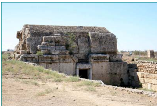
Cárcel de Santa Catalina

Después nos dirigiremos a la Necrópolis de Salamina , que se halla a pocos kilómetros del yacimiento, conocida con el nombre de “ Tumbas Reales ”.