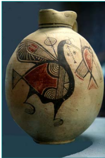
Resulta muy interesante la sala con las reconstrucciones de tumbas antiguas desde el IV milenio hasta el siglo IV a.C. y las tumbas reales de Salamina.

Iniciaremos la mañana visitando el interesante Museo Arqueológico , la pequeña Catedral ortodoxa de San Juan obra del siglo XVII con hermosos frescos del XVIII, el Museo Bizantino con una impresionante colección de 150 iconos y frescos de iglesias y monasterios de Chipre que datan del periodo comprendido entre los siglos IX al XVIII, considerado uno de los mejores museos bizantinos del mundo. Después de un paseo por las murallas venecianas de la vieja ciudad y la Puerta de Famagusta , llegaremos al pequeño y pintoresco barrio de ' Laiki Geitonia ' con callejones, casas señoriales con balcones labrados y pequeños talleres antiguos, hasta llegar a la calle Ledra , repleta de restaurantes, donde se encuentra el paso fronterizo peatonal. En uno de ellos almorzaremos.