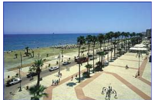
Paseo de las Palmeras

Comenzaremos visitaremos el Museo de la Fundación Piérides que alberga una valiosa colección de antigüedades chipriotas, fruto de la colección de cinco generaciones de la familia Piérides iniciada por Demetrios Piérides (1811-1895).