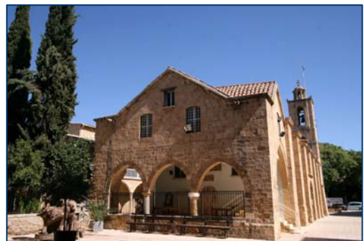
Catedral de San Juan. Nicosia Sur