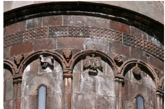
Detalle de la decoración del tambor de la cúpula de la iglesia Katholiik

En las paredes rocosas que lo rodean hay decenas de cuevas que antaño dieron refugio a los eremitas que habitaron el lugar.