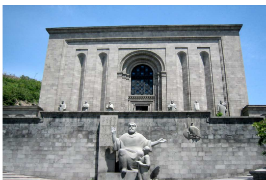
Matednadaran (Museo de Antiguos Manuscritos)

Desayuno. Ascenderemos al Monumento a la “Madre Armenia” (Mair-Hayastan) , erigido en 1960, desde donde se divisa una excelente panorámica de la ciudad y del Monte Ararat. Después visitaremos el Museo de Antiguos Manuscritos, (Matenadaran) , considerado una de las joyas de Yereván por custodiar antiquísimos manuscritos de los siglos V y VI, entre ellos una Biblia, tratados de Historia, Teología, Filosofía, Ciencias Naturales, etc.