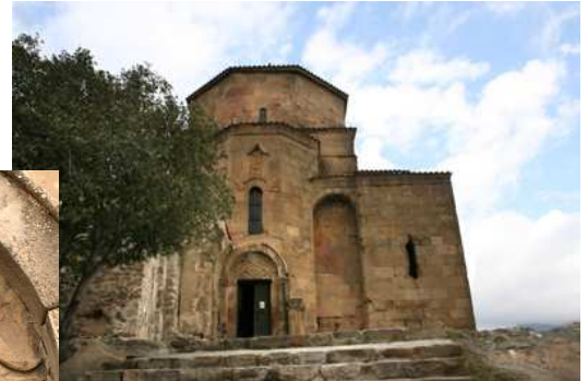
Tímpano Iglesia de .Santa Cruz

Regreso a Tbilisi. Cena libre. Alojamiento.