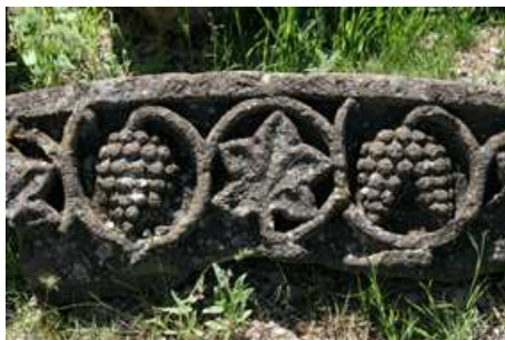
Detalle archivolta decorada con roleos de vid.

Su original composición arquitectónica, sus dimensiones, su disposición espacial y su decoración la hicieron única, apreciándose ciertas influencias del Arte Cristiano de Siria. En el año 930 un terremoto causó el derrumbe del edificio, que nunca llegó a restaurarse. Hoy sus espléndidas ruinas están consideradas Patrimonio de la Humanidad, por la UNESCO.