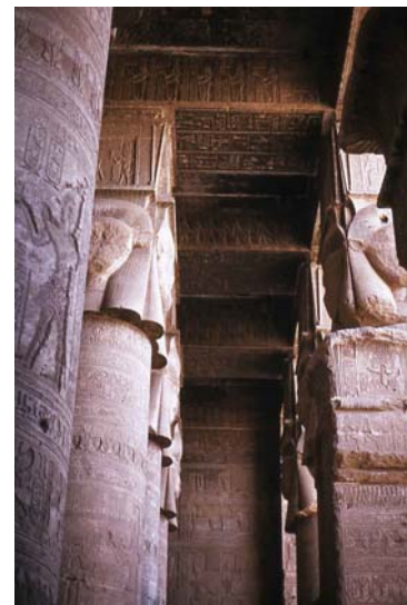
Templo de Hathor. Sala Hipetra

Concluida la visita regresaremos a Luxor. Almuerzo a bordo.