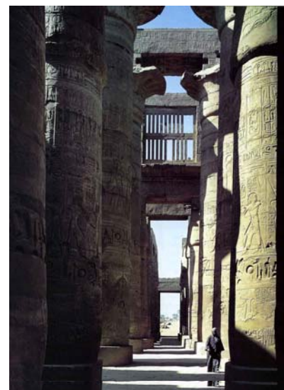
Templo de Amón. Sala hipóstila.