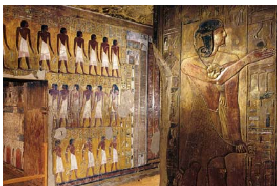
Tumba de Seti I

Allí, -en tumbas rupestres (“hipogeos”) bellamente decoradas con pinturas murales y relatos simbólicos del viaje de los muertos al inframundo, formadas por corredores descendentes, pozos de drenaje, cámaras funerarias y cámara del sarcófago- recibieron sepultura todos los reyes del Imperio Nuevo a partir de Tutmosis. El wadi Biban el-Moluk, más conocido como Valle de los Reyes, está dividido en dos ramales: el oriental ocupa la zona central y contiene la mayor parte de las tumbas, mientras que el occidental sólo alberga las sepulturas de Amenofis III y Eye.