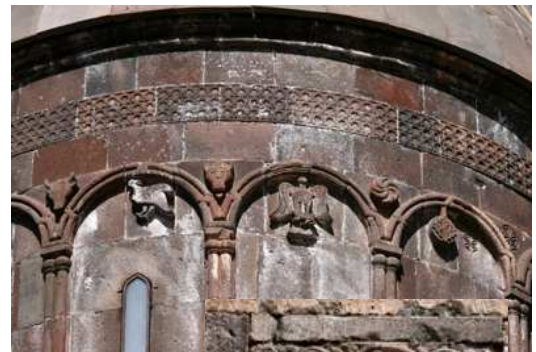
Detalle de la decoración del tambor de la cúpula de la iglesia Kathoghike, (la principal iglesia del monasterio)