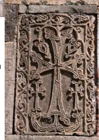
Cruz armenia esculpida en el muro exterior de la iglesia de Kathoghike.

Concluida la visita nos dirigiremos al pueblo de Garni donde almorzaremos, para visitar después el Templo de Garni que se halla a orillas del río Arat. Es un impresionante monumento de la arquitectura clásica, obra del siglo I después de Cristo, construido por el rey Tiridates I de Armenia.