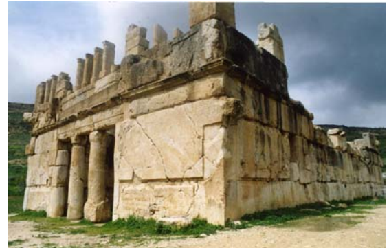
Palacio de al-Abd

Es una villa de campo anterior a los romanos, extraordinariamente bella, que se encuentra situada en un magnífico campo cerca de un antiguo sistema de cuevas conocido como Iraq al-Amir ("Cuevas del Príncipe") y constituye uno de los pocos ejemplos de arquitectura helenística que se encuentran en Oriente Próximo.