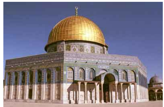
Cúpula de la Roca

Si le gusta el arte islámico le proponemos acceder al Monte del Templo o Monte Moria y recorrerlo con calma, deleitándose en la contemplación de la Cúpula de la Roca y de la Mezquita Al Aqsa (construidas a lo largo de los siglos VII y VIII), ver la Cúpula de la Cadena , el mimbar del juez Burhan el-Din (ayubi) , el sabil del sultán Qaytbay , las madrasas Uthmaniyya y Ashraliyya (auténtica gema