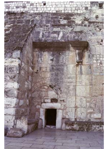
Entrada de la Basílica de la Natividad. Belén