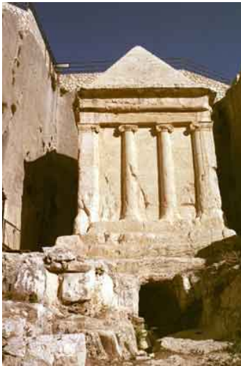
Tumba de Zacarias. Valle del Cedrón

Si prefiere la tranquilidad, puede adentrarse en el silencioso y pausado Barrio Armenio y visitar la Catedral de Santiago , la Casa de San Marcos y callejear por sus austeras e intrincadas calles de aspecto de fortaleza.