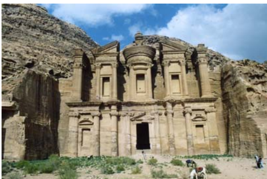
Monasterio (Al Deir)

Desde allí iniciaremos el regreso al hotel, y nuevamente a través del “ siq ” volveremos a fascinarnos con el entorno que nos rodea, pero esta vez a la luz del atardecer.