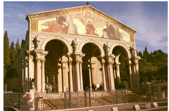
Basílica de Getsemani