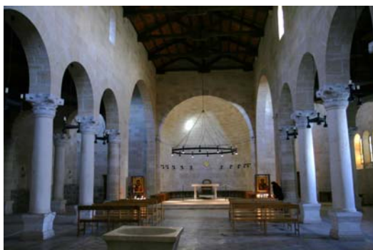
Iglesia de la Multiplicación de los Panes y Peces

Continuaremos hacia Tabgha (Ein Sheva), uno de los lugares más importantes del magisterio de Cristo en Galilea, donde acaeció el milagro de la multiplicación de los panes y los peces. Allí, en el siglo V, se construyó una iglesia bizantina con bellos mosaicos, sobre cuyos cimientos se edificó en 1982 la actual Iglesia de la Multiplicación de los panes y los peces que visitaremos.