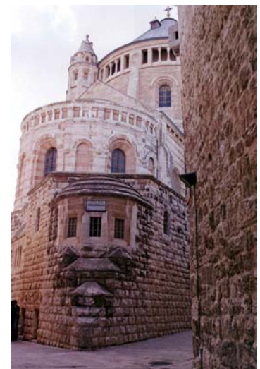
Abadía de la Dormición