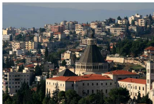
Basílica de la Anunciación

En la segunda mitad del siglo XVII los franciscanos iniciaron la reconstrucción de los santos lugares, y así surgió en Belén la mayor iglesia cristiana de Oriente Próximo, la Basílica de la Anunciación diseñada por el arquitecto italiano Giovanni Muzio y consagrada en 1968. En el corazón de la basílica se haya la Gruta de la Anunciación , la antigua cueva-vivienda que los cruzados convirtieron en capilla.