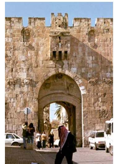
Puerta de Los Leones (Bad al-Ghor)

Capilla de la Condenación , hasta llegar al centro de la Cristiandad, a la indescriptible Basílica del Santo Sepulcro , edificada, según la tradición, sobre los lugares en que Jesús fue crucificado y sepultado.