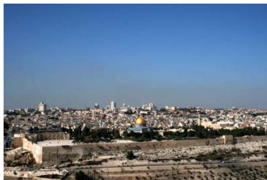
Vista panorámica de la ciudad viajera de Jerusalén

Descenderemos hasta el Valle de Cedrón (o Valle de Josafat) y allí, al pie de la colina, entre olivos centenarios testigos de la agonía y prendimiento de Cristo se halla el Huerto de Getsemaní y la Iglesia de las Naciones (o de la Agonía), que visitaremos.