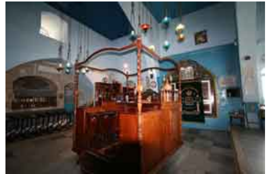
Sinagoga de Joseph Caro

Descenderemos hacia la bellísima ciudad de Akko (San Juan de Acre) , bañada por el Mediterráneo. Hoy Patrimonio de la Humanidad y en otro tiempo capital del Reino Latino de Jerusalén, sede central de los Caballeros Cruzados e importantísimo puerto comercial durante la Edad Media, para apreciar sus fortificaciones medievales .