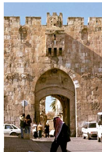
Puerta de Los Leones (Bad al-Ghor)