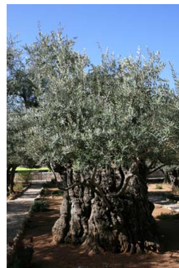
Huerto de Getsemaní

Descenderemos hasta el Valle de Cedrón (o Valle de Josafat) y allí, al pie de la colina, entre olivos centenarios testigos de la agonía y prendimiento de Cristo se halla el Huerto de Getsemaní y la Iglesia de las Naciones (o de la Agonía) que visitaremos.