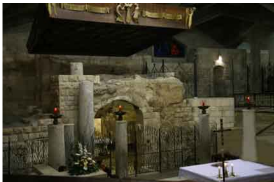
Gruta de la Anunciación. Basílica de la Anunciación

En la segunda mitad del siglo XVII los franciscanos iniciaron la reconstrucción de los santos lugares, y así surgió en Belén la mayor iglesia cristiana de Oriente Próximo, la Basílica de la Anunciación diseñada por el arquitecto italiano Giovanni Muzio y consagrada en 1968. En el corazón de la basílica se haya la Gruta de la Anunciación , la antigua cueva-vivienda que los cruzados convirtieron en capilla.