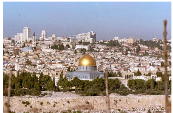
Vista de Jerusalén desde el Monte de los Olivos

Desayuno y salida para visitar la ciudad nueva de Jerusalén. Comenzaremos dirigiéndonos al Monte Scopus y al Monte de los Olivos desde donde disfrutaremos de una magnífica vista panorámica de la ciudad y podremos identificar cada uno de los monumentos emblemáticos de la vieja ciudad.