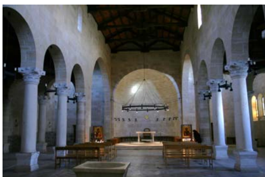
Iglesia de la Multiplicación de los panes y peces

Continuaremos hacia Tabgha (Ein Sheva), uno de los lugares más importantes del magisterio de Cristo en Galilea, donde tuvo lugar el milagro de la multiplicación de los panes y los peces. Allí, en el siglo V, se construyó una iglesia bizantina con bellos mosaicos, sobre cuyos cimientos se edificó en 1982 la actual Iglesia de la Multiplicación de los panes y los peces que visitaremos.