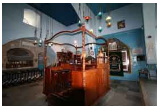
Sinagoga de Joseph Caro

Después descenderemos hacia la bellísima ciudad de Akko (San Juan de Acre) bañada por el Mediterráneo. Hoy Patrimonio de la Humanidad y en otro tiempo capital del Reino Latino de Jerusalén, sede central de los Caballeros Cruzados e importantísimo puerto comercial durante la Edad Media, para apreciar sus fortificaciones medievales .