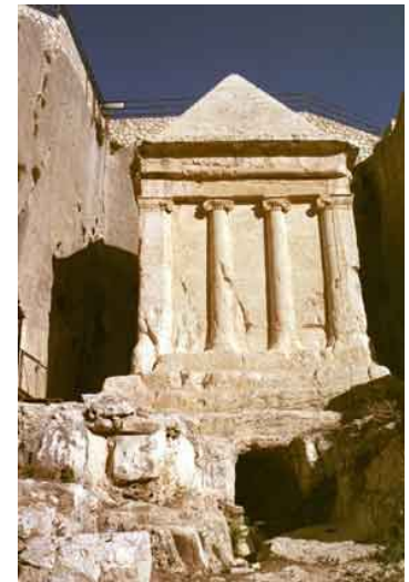
Tumba de Zacarias

Puede visitar los Túneles del muro Oeste del Monte del Templo . Recientes excavaciones han sacado a la luz pasadizos, salas públicas, canales de agua del periodo hasmoneo y secciones del camino del Segundo Templo. Estos túneles de veinte siglos de antigüedad fueron utilizados por los judíos para huir del saqueo de Jerusalén por los romanos en el año 70.